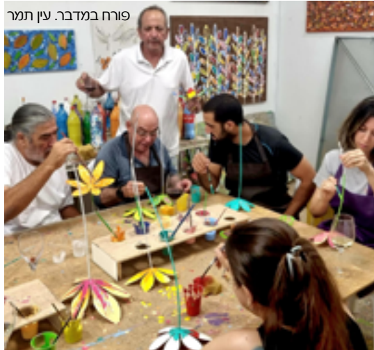
פורח במדבר. עין תמר