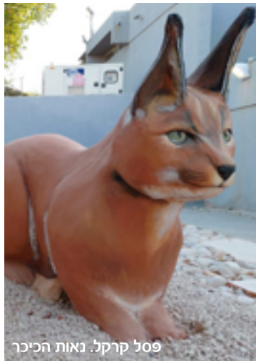
פסל קרקל. נאות הכיכר