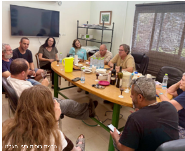
הרמת כוסית בעין חצבה