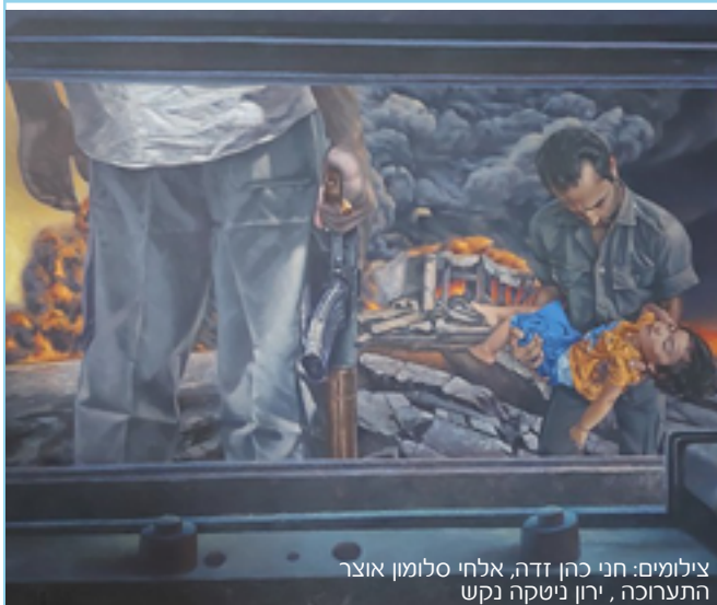
ציולמים: חני כהן זדה, אלחי סלומון אוצר התערוכה, ירון ניטקה נקש