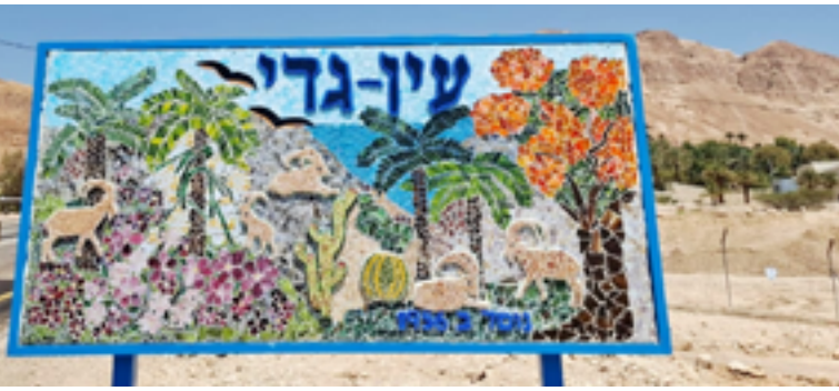
צילומי חברים חדשים: נמרוד הקר ורז לוגסי