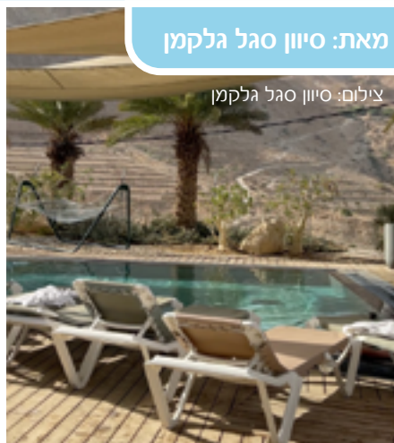
מאת: סיוון סגל גלקמן