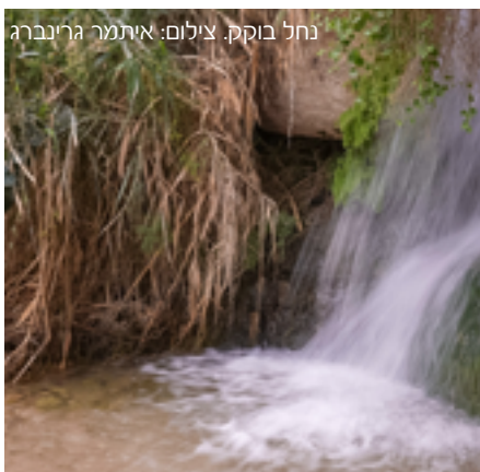
נחל בוקק.