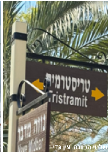
שלטי הכוונה. עין גדי