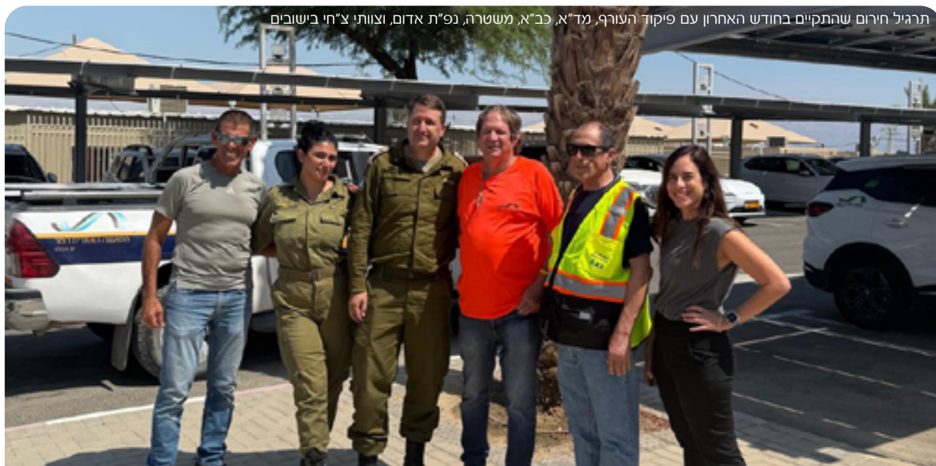
תרגיל חירום שהתקיים בחודש האחרון עם פיקוד העורף, מד"א, כב"א, משטרה, נפ"ת אדום, וצוותי צ"ח ביישובים

לצד ענף המלונאות שכאמור פחות נפגע, פער ניכר שאנו מתמודדים איתו מול רשויות המדינה, נעוץ בצורה בה הם מסתכלים על התיירות בים המלח, מבלי לתת את הדעת על ענפים אחרים, בדגש על עסקים קטנים שחוו ירידה דרמטית בהכנסות. מדובר על מורי דרך, מדריכי טיולים, צימרים, עסקי הסעדה ועוד. המשותף לכולם הוא הישענות על תיירות נכנסת, שלמרבה הצער במציאות הנוכחית כמעט ואינה מגיעה לארץ.