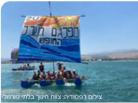
צילום רפסודיה: צוות חינוך בלתי פורמלי