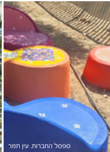
פסל החברות. עין תמר