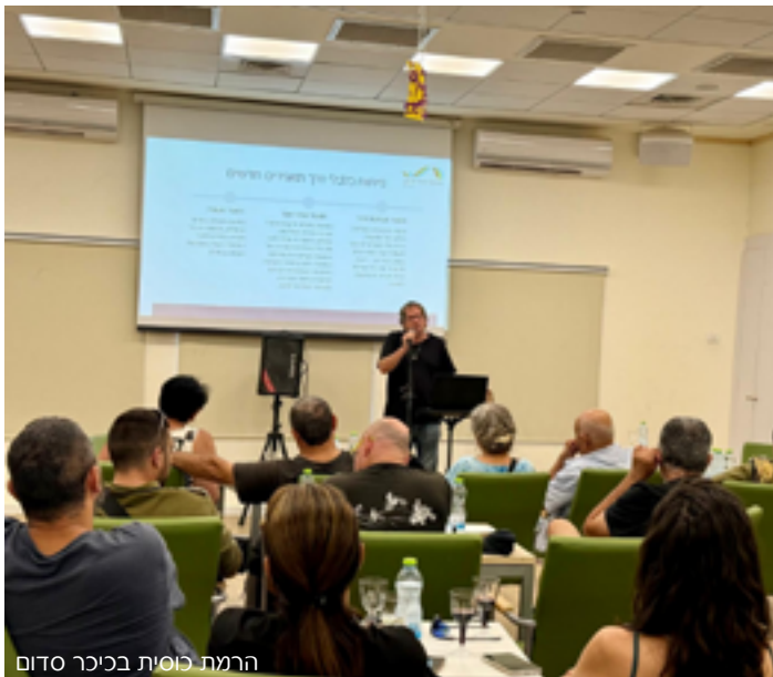
הרמת כוסית בכיכר סדום

”יש שיתוף פעולה מצוין עם הנהלות הישובים, מזכירי הישובים ובעלי התפקידים השונים - רבש”צים, צוותי צח”י. ראינו זאת הלכה למעשה גם בתקופות החירום וגם בשוטף”