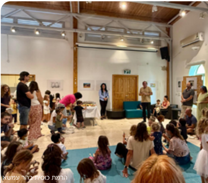
הרמת כוסית בהר עמשא