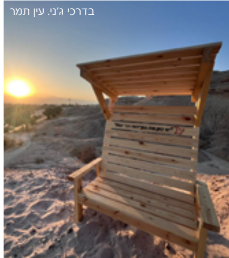
בדרכי ג'ני. עין תמר

ק ול קורא להגשמת יוזמות קהילתיות בהובלת המועצה האזורית תמר הוביל בשנה החולפת למימוש שורה של פרויקטים יוצאי דופן. לקרוא ולהתמלא באווה