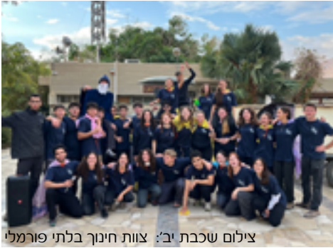
צילום שכבת יב: צוות חינוך בלתי פורמלי