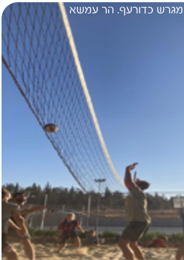
מגרש כדורעף. הר עמשא