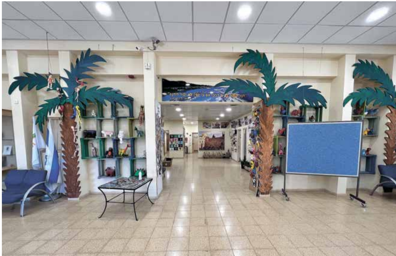
בית הספר "תמר" בעין גדי. ייש ניסיון ליצור לילדים שפע של אפשרויות והתנסויות

וכמוכן, מתוך כל אחת מהתפישות נגזרות עוד המון סוגיות משנה. למשל, בתפישה שלפיה החינוך פונה לעתיד, אפשר