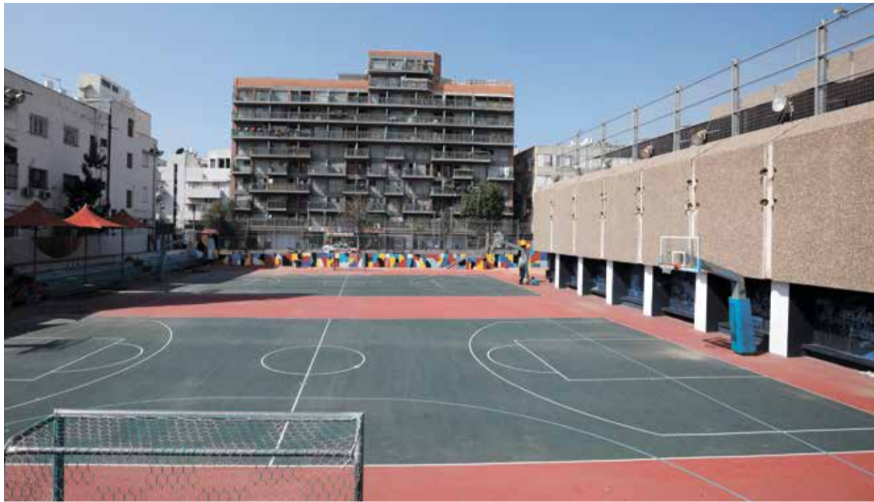
בית הספר ביאליק-רוגוזין בתל אביב. מרחב כאוטי ורווי אלימות

הוא לא פסימי, אבל יש בו משהו מאוד מפוכח. "זה נכון, במובן זה שאני לא מאמין שניתן לשנות בתי ספר. אבל אני גם משוכנע שזה לא אומר שלא ראוי לנסות לעשות את המיטב. התקווה היא הכרחית של המורה. אבל השאלה האמיתית היא אם המקצועות האלה תיתת היא אם המקצועות האלה בכלל חשובים לנו, ואם כן איך מרימים מחדש את קרנם. זו שאלה שמעמטים מדי לשאול".