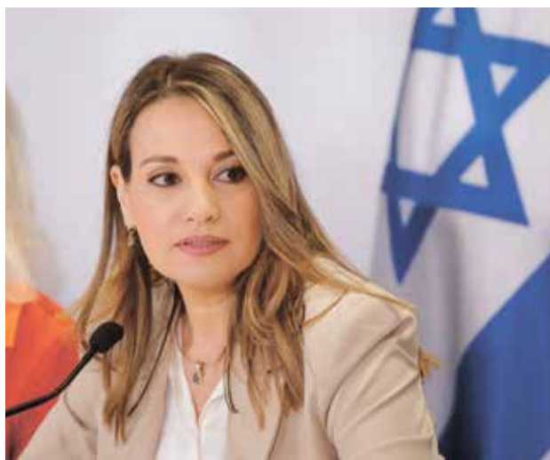
השרה שאשא ביטון מודיעה על הרפורמה בנגרות