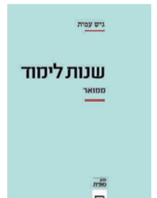
עטיפת הספר צילום: עיצוב עטיפה: דפנה גריף / הוצאת הקיבוץ המאוחד

אנחנו נפגשים בקיבוץ עין גדי, שם הוא מתגורר ועובד בשנתיים וחצי האחרונות, מנהל את בית הספר היסודי תמר, בית ספר "רגיל", במובן זה שאינו מחויב לאידיאולוגיה כלשהי, אבל עמית מקווה שהוא "לא רגיל", במובן זה שיש בו ניסיון ליצור לילדים שפע אפשרויות, התנסויות ושיעורים, משיעורי פילוסופיה, שאני עצמי מלמד, ועד שיעורי דרמה ומחול".