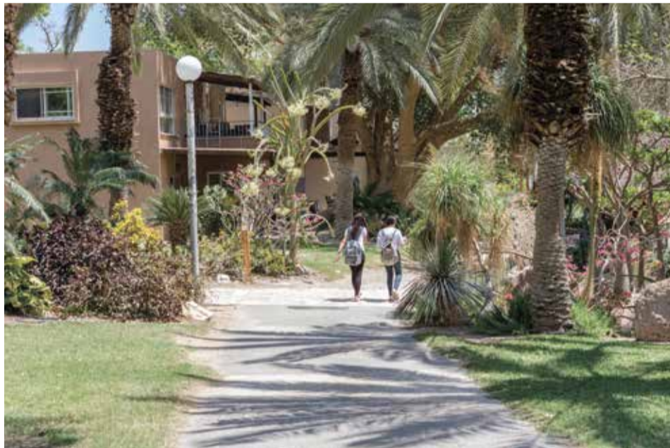
עין גדי. אפשר להסתדר גם בלי הארנק

להתייצב ולהתכונן נכוחה בחוסר האונים שלנו, ואני מאמין בכל לבי, שהמעשה החינוכי דורש הכרה עמוקה באוזלת היד. אני מאמין שההתערבויות שלנו צריכות להיות מדודות ככל האפשר, במיוחד כשהדברים נוגעים לעניינים בעולמם החברתי של הילדים, שהוא מורכב ועדין מאוד, ומשום שכל כך קל לקלקל".